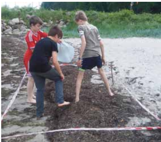
Im Strandanwurf finden sich viele Organismen - aber auch jede Menge Dinge, die dort eigentlich nicht hingehören.

Auf der Lotseninsel stand das Keschern und Untersuchen von Meereslebewesen im Vordergrund. Mit Mikroskop und Stereolupe und angeleitet durch die Teamer konnten sich die Kinder eine ganz neue Welt erschließen. Hinzu kamen ornithologische Führungen in das benachbarte