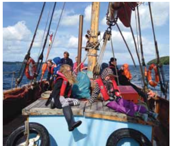
Die „Bodil“ wurde zum Forschungsschiff, von dem aus immer wieder das Meer untersucht wurde.

Während der drei Tage an Bord der Bodil haben die Kinder mit der Secchischeibe die Sichttiefe