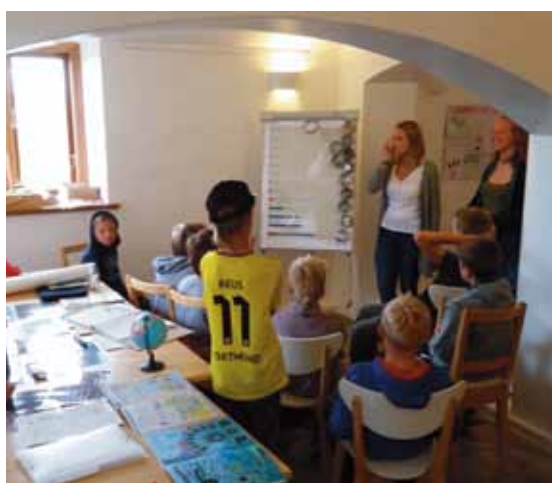
Im Seminarraum des Lotsenhauses standen wurden die Funde zusammengetragen und untersucht.

Gegen Ende der Ferienaktion haben die Kinder ihre „Utopienwolke“ erstellt und sich überlegt, wie sie sich ihre Welt eigentlich vorstellen. Abschließend waren die Kinder dazu aufgerufen, ei-